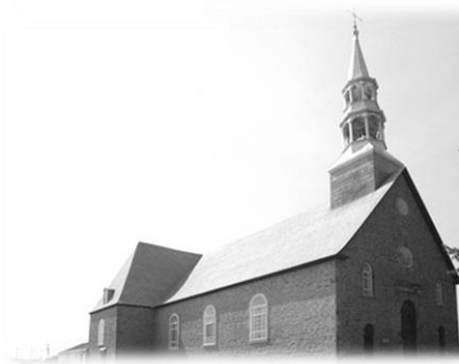
Église de Saint-Paul