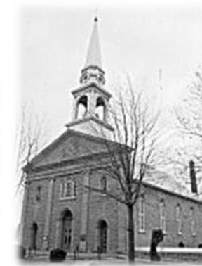
Communauté de Saint-Thomas