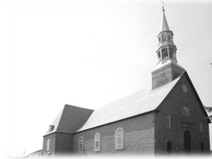
Communauté de Saint-Paul